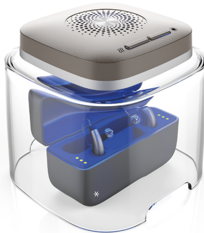
* Geeignet für alle Hörsystem- und Ohrhörer-Ladegeräte